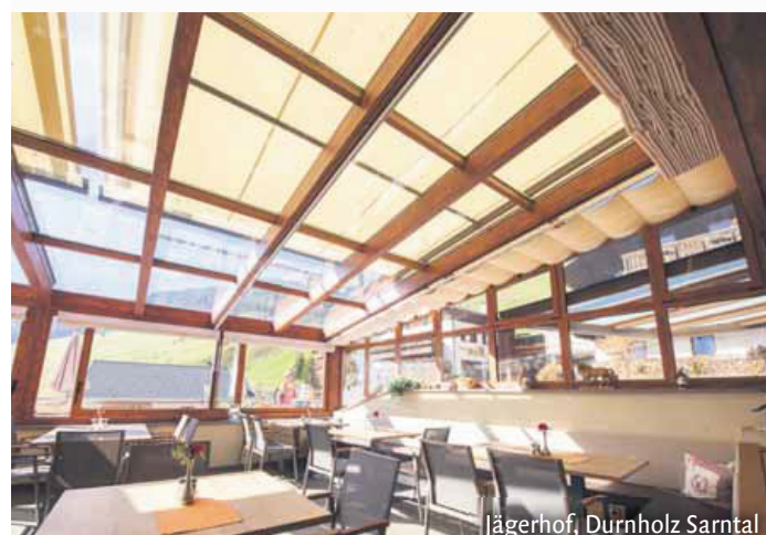
Jägerhof, Durnholz Sarntal

Großflächenmarkisen - garantiert wind- und wetterfeste Markisen, einzigartige Markisenanlagen für Privat und Gastronomie.