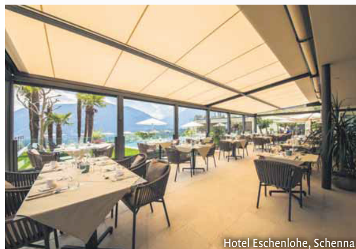
Hotel Eschenlohe, Schenna

auch schattig bleiben. Da kann sich das Wetter drehen und wenden wie es will. Damit das auch in Zukunft so bleibt, bauen wir alles selbst. Unsere Mitarbeiter erledigen von der technischen Planung über die Herstellung bis zur Montage alles in Eigenarbeit. Glauben Sie, dass wir uns neben dem Südtiroler Wetter auch mit Hitze und Wolkenbrüchen in Italien, der Schweiz in Deutschland und Europa beschäftigen würden, wenn wir nicht die neueste Technik und beste Qualität liefern würden?