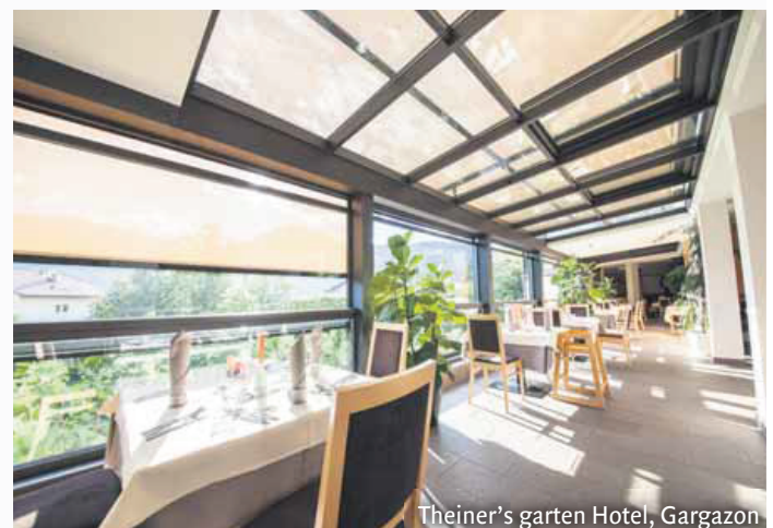
Theiner's garten Hotel, Gargazon