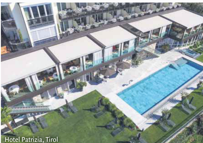
Hotel Patrizia, Tirol